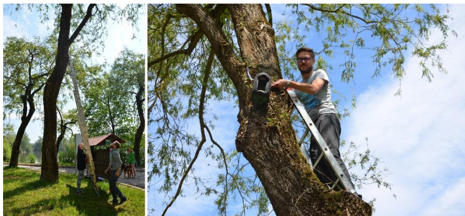
Slika 2: Nameščanje netopirnic ob Koseškem bajerju 9. maja 2016 (Foto: N. Krivec).