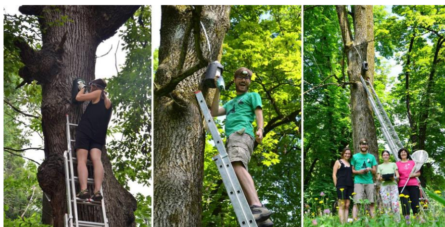
Slika 5: Drugo pregledovanje netopirnic.