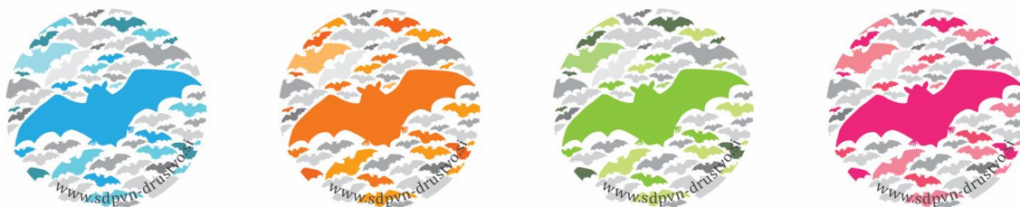
Slika 18: Štirje barvni motivi promocijskih priponk izdelanih v sklopu projekta.

Za izdelavo promocijskih priponk smo oblikovali 4 barvne motive silhuet netopirjev, ki smo jim pripisali tudi naslov spletne strani Slovenskega društva za proučevanje in varstvo netopirjev (Slika 18). Tako smo želeli na preprost način pripomoči k širjenju zavedanja o prisotnosti netopirjev v naši bližini, hkrati pa podati informacijo o tem, kje si lahko ljudje preberejo več o netopirjih in samem projektu. Priponke smo natisnili v nakladi 2.000 kosov in jih razdeljevali na projektih aktivnostih.