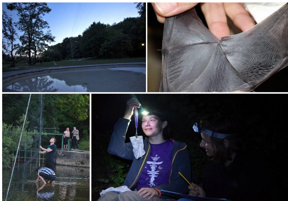
Slika 11: Raziskovanje netopirjev z metodo lova v mreže, zg. desno – mreže razpete na Z bregu Tivolskega ribnika; zg. levo- primerjava osifikacije sklepov 5. prsta pri odraslem in mladiču; spodaj – postavljanje mrež in merjenje ujetih netopirjev na terenu pri Bokalcach