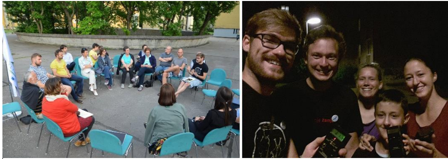
Slika 23: Posvet na temo ohranjanja enotne podobe soseske ob obnovah fasad in varstva zatočišč netopirjev v soseski Ruski car ter udeleženci večernega sprehoda s poslušanjem netopirjev z ultrazvočnimi detektorji.

Dogodek smo oglaševali v glasilu Mestne občine Ljubljana in v programu ČS Posavje. (Prilogi 22, 23) ter na facebooku (Priloga 24).