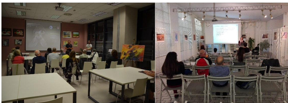
Slika 19: Predavanje v knjižnici Šiška (levo) in v knjižnici Prežihov Voranc na Viču (desno).