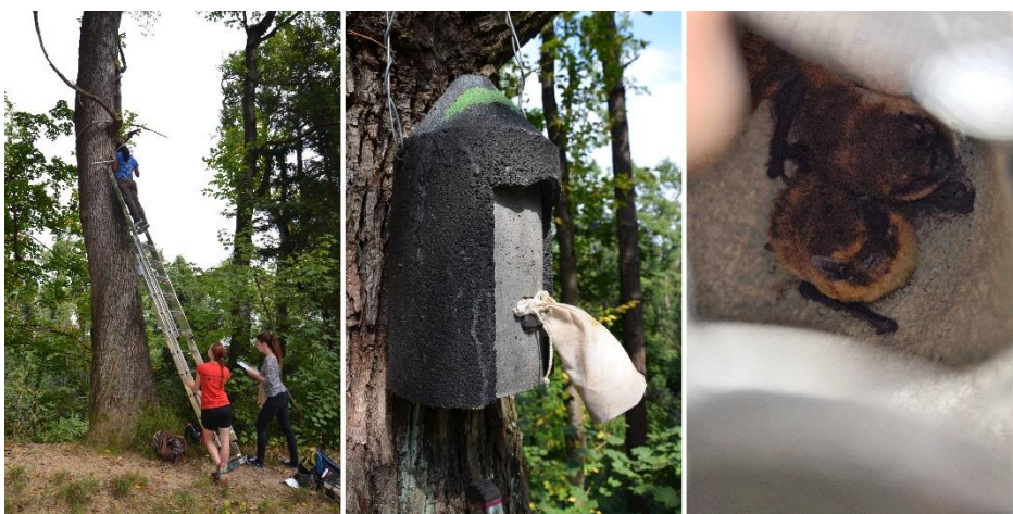
Slika 7: levo – Ekipa na tretjem pregledu drevesnih netopirnic v septembru; sredina – pred odpiranjem netopirnic smo preletno odprtino zaprli, da netopirji ne bi pobegnili skozi; desno – stiskajoči se drobni netopirji ( P. pygmaeus ) v eni izmed netopirnic.

V 4 od 6 netopirnicah, ki so bile nameščene leta 2015 na drevesa znotraj KP Tivoli, Rožnik in Šišenski hrib, so se ob tretjem pregledu v jesenskem času zadrževali netopirji (Tabela 4). V njih smo našli skupaj 18 drobnih netopirjev ( P. pygmaeus ), od tega tako samice (skupno 8), kot tudi odrasle samce (skupno 6). Najdbe v jesenskem paritvenem obdobju skupaj z nabreklostjo testisov in obmodkov pri treh odraslih samcih nakazujejo, da netopirnice uporabljajo tako za začasno zatočišče, kakor tudi za parišče.