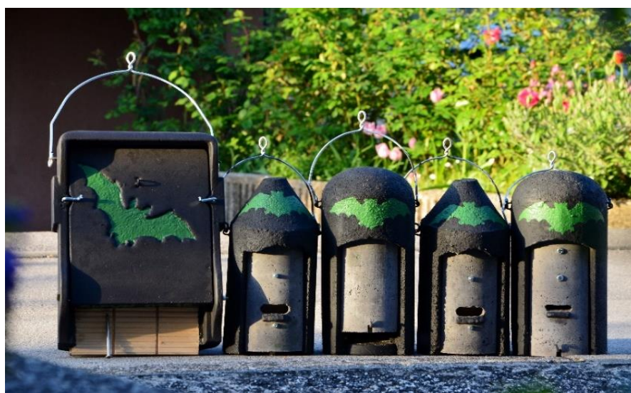
Slika 1: Različni tipi kupljenih netopirnic; od leve proti desni: Schwegler 1FF, 2F, 2FN, 2F in 1FD.