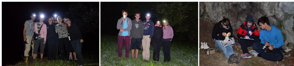
Slika 12: Terensko raziskovanje netopirjev; teren pri ribnikih v Spodnjih Gameljnah; skupinska s terena pri Besnici; določanje netopirjev na terenu pred Jelenca jamo (Foto: S. Zidar).

Cilj lova netopirjev v mreže je bil predvsem popis netopirskih vrst, ki jih ne moremo zaznati z drugimi raziskovalnimi metodami (npr. ultrazvočnimi detektorji). Na območju MOL smo tekom raziskave zabeležili prisotnost 9 vrst netopirjev, ki so predstavljene v Tabeli 9.