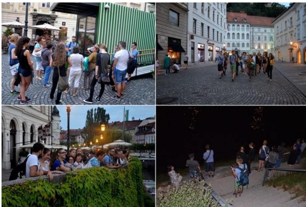
Slika 21: zg. levo: Kratko predavanje pred magistratom in sprehod po Stritarjevi ,ulici do Tromostovja; spodaj: začetek poslušanja pri Tromostovju (levo) in zaključek na Grudnovem nabrežju (desno).

Sprehod ob Ljubljani smo oglaševali na spletni strani www.napovednik.com , na Facebook strani "Netopirji - skrivnostni Ljubljanci" in na spletni strani SDPVN.