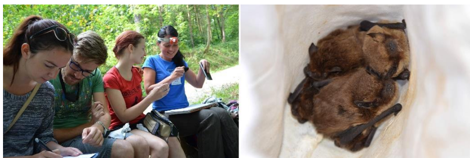
Slika 8: Najdene netopirje smo previdno izmerili, določili značilnosti in stekali.