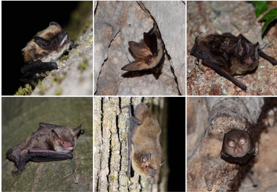
Slika 12: Nekaj vrst netopirjev zabeleženih znotraj MOL v projektnih raziskavah; zg. - Savijev netopir ( H. savii ), rjavi uhati netopir ( P. auritus ), širokouhi netopir ( Barbastella barbastellus ); sp. - resasti netopir ( M. nattereri ), drobni netopir ( P. pygmaeus ) in mali podkovernjak ( R. hipposideros ) (Foto: Ž. Bombek, S. Zidar).