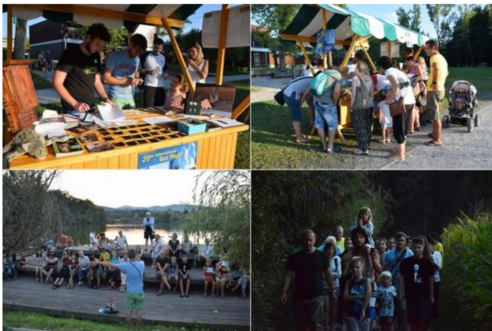
Slika 22: zgoraj: Stojnica s promocijskim materialom je pritegnila lepo število mimoidočih; sp. levo: Predavanje v naravi; sp. desno: Obiskovalci sprehoda z detektorji v rokah.

preko sporočila medijem in objavljen v Dnevniku (Priloga 21), radijsko povabilo pa je bilo predvajan na Radiu Prvi.