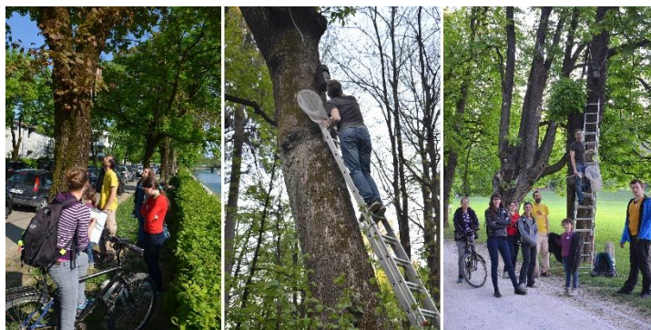
Slika 3: Na povabilo na prvi pregled netopirnic na drevju 22. aprila 2016 se je odzvalo tudi precej članov Slovenskega društva za proučevanje in varstvo netopirjev.

Prvi pregled netopirnic smo opravili v aprilu, torej v obdobju spomladanskih selitev netopirjev. Pregledali smo lesene ploščate netopirnice, nameščene na drevesa ob Ljubljani na Grubarjevem nabrežju in na Prulah (SDPVN 01-08, 06-08, 07-08) ter 6 lesobetonskih netopirnic, postavljenih na drevesa v letu 2015 znotraj KP Tivoli, Rožnik in Šišenski hrib. V dveh netopirnicah ob poti na Šišenski hrib smo našli sledi uporabe netopirnic s strani netopirjev, njihove iztrebke – gvano (glej Tabela 4). Najdba majhnih količin gvana majhne velikosti kaže na uporabo netopirnice majše vrste netopirjev vsaj za kratek čas v prehodnem obdobju selitev, med 27. oktobrom (predhodnji pregled) in 22. aprilom. Najdba gvana nakazuje, da netopirji že v zelo kratkem obdobju prepoznajo netopirnice kot ustrezne strukture v okolju.