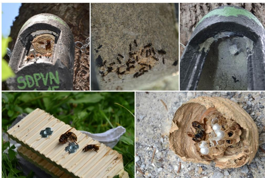
Slika 4: Drugi pregled netopirnic je razkril uporabo 10 od 12 pregledanih netopirnic; od levo zgoraj v smeri urinega kazalca: aktivno sršenje gnezdo (SDPVN 01-15), mravlje in njihova jajca (SDPVN 04-16), pajek (SDPVN 04-15), sršeni (sdpvn 02-15), opuščeno sršenje gnezdo (SDPVN 05-15).

Netopirji so najbolj aktivni v poletnih mesecih, zato smo drugi pregled izvedli julija, saj bi na tak način lahko potencialno zaznali tudi uporabo netopirnic kot kotišča netopirjev. Pregledali smo 12 lesobetonskih netopirnic, ki smo jih namestili na drevesa v letu 2015 in v maju 2016 (Tabela 4). V 10 netopirnicah smo našli živali ali sledi uporabe netopirnic: v 3 smo našli gnezdo sršenov (Slika 4), v 1 osje gnezdo, v polovici pregledanih netopirnic mravlje ali njihova gnezda (Slika 4), v nekaj njih pa tudi različne vrste pajkov. V netopirnici tipa Schwegler 2F (splošna, srednja velikost vhoda, brez pregradnih panelov) smo odkrili gvano majhne velikosti in 1 netopirja - odraslega samca drobnega netopirja ( Pipistrellus pygmaeus ) (Slika 6). Vrsta je predstavljala tudi najbolj številčen ulov v raziskavi z lovom v mreže ob Tivolskem ribniku v letu 2015, zato predvidevamo, da gre za relativno pogosto vrsto na območju parka. Dodatno smo še v eni netopirnici poleg opuščene gnezda sršenov in mravelj našli nekaj malega gvana. Netopirnice, v katere so se naselili sršeni, zaradi varnosti po odprtju nismo zapirali s pokrovom.