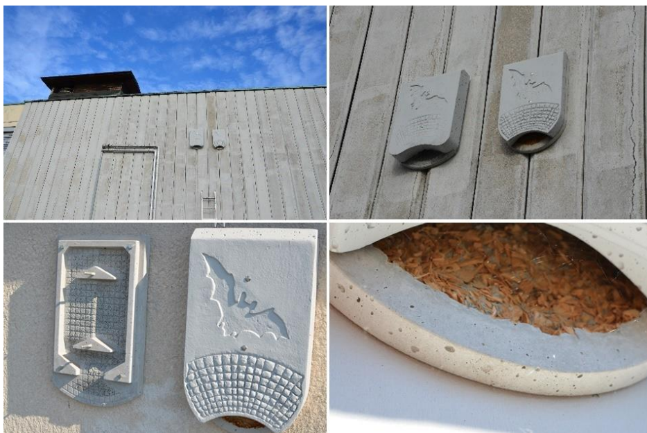
Slika 10: Pregledovanje netopirnic na stavbah ni pokazalo njihove uporabe (zgoraj: netopirnici na Strojni fakulteti; sp. levo: odprta netopirnica na Akademskem kolegiju; sp. desno: pajčevina na vhodu ene izmed netopirnic na Jakčevi 43..

Na vseh treh lokacijah, kjer smo v letu 2015 namestili stavbne netopirnice, smo izvedli dva pregleda (Tabela 3). Na nobenem pregledu nismo opazili netopirjev oz. zasledili znakov netopirske naselitve ali uporabe. Do prepoznavne in prve zasedbe netopirnic lahko sicer po podatkih iz tujine pride tudi šele po več letih.