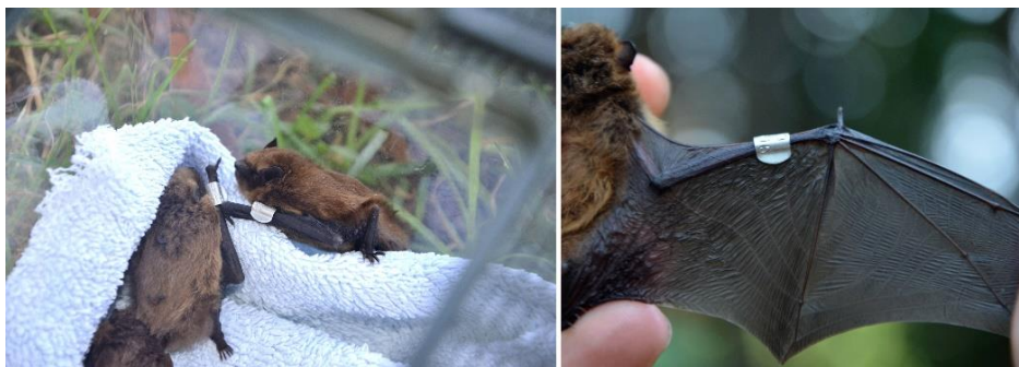
Slika 9: Najdene netopirje smo začasno dali v plastični terarij, vse pa tudi označili z alumijastimi obročki, ki niso sklenjeni kot pri pticah, zato ne poškodujejo prhuti.

Z namenom nadaljnega spremljanja zasedenosti netopirnic in potencialnih selitev netopirjev smo vse ujete netopirje tudi obročkali z alumijastimi obročki v sodelovanju s Slovenskim centrom za obročkanje netopirjev. Vsak obroček nosi unikatno oznako, po kateri je možno določeni osebek prepoznati.