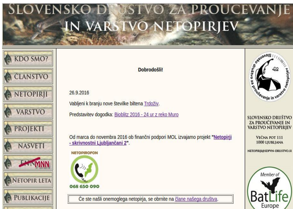
Slika 16: Domača stran spletne strani Slovenskega društva za proučevanje in varstvo netopirjev (14. 10. 2016) s povezavo na opis projekta in z logotipom Netopirofona.