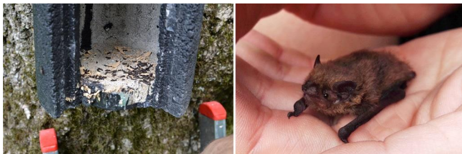
Slika 6: levo - Zasedenost netopirnice nam lahko izda že prisotnost gvana; desno – drobni netopir ( Pipistrellus pygmaeus ) najden v netopirnici na drugem pregledu.