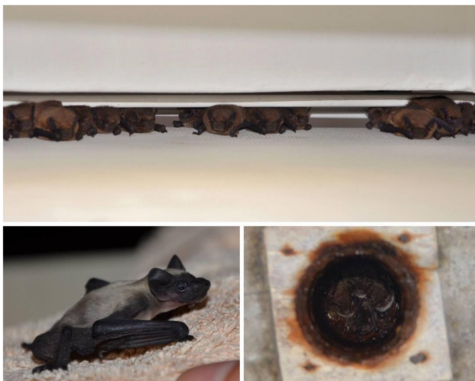
Slika 13: zg. - Roječi drobni netopirji ( P. pygmaeus ) so se čez dan v stanovanju v centru Ljubljane takole skrili v špranjo rolete (Foto: S. Zidar); sp. – najdbe mladičev kažejo, da imajo na območju Bratovševe in Glinškove ploščadi kotišča tudi Savijevi netopirji ( H. savii ) (Foto: S. Zidar); najdba kotišča obvodnih netopirjev ( M. daubentonii ) v odtočnih ceveh mostu nad Gradaščico pri Bokalcah (Foto: N. Krivec).

Najpomembnejše nove najdbe so najdbe mladičev, ki pričajo o razmnoževanju in kotiščih teh vrst znotraj Ljubljane (Savijev netopir H. savii in usnjebradi uhati netopir Pl. macrobullaris ). V samem centru prestolnice pa smo se srečali tudi z dvema primeroma jesenskega rojenja drobnih netopirjev ( Pipistrellus pygmaeus ). Vedenje je značilno za male netopirje in verjetno povezano z razmnoževanjem. V obeh primerih je šlo za starejši tip gradnje, v višjih nadstropjih prostorov z visokimi stropovi, kjer je v večernem času intenzivno preletavalo veliko število netopirjev.