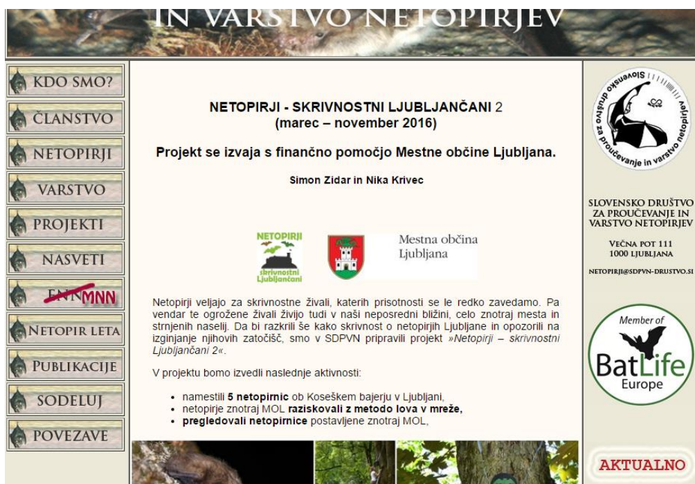
Slika 17: Opis projekta na spletni strani Slovenskega društva za proučevanje in varstvo netopirjev (17. 10. 2016).