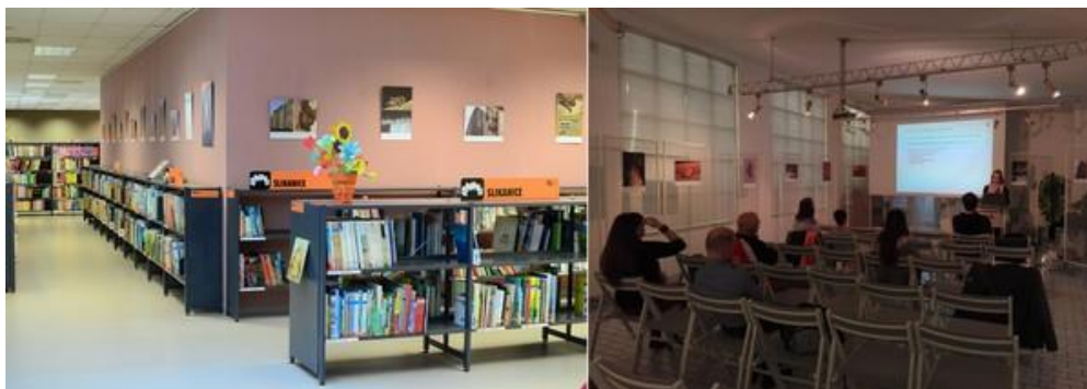
Slika 20: Razstava v knjižnici Šiška in otvoritev razstave s predavanjem v razstavnem prostoru v knjižnici Prežihov Voranc na Viču (Foto: N. Krivec in T. Kenda).